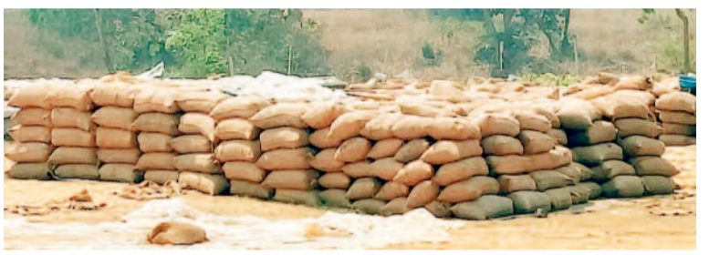
समिति में धान खरीदी को लेकर जीरो करने के एवज में खपाया जा रहा धान